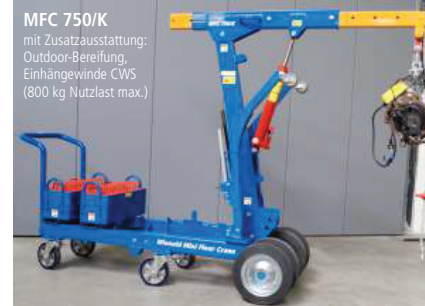
MFC 750/K mit Zusatzausstattung: Outdoor-Bereifung, Einhängwinde CWS (800 kg Nutzlast max.)

Aufgrund seiner schlanken Bauweise passt ein MFC in jeden Standard Fahrstuhl. Bei Bedarf lässt er sich mit wenigen Handgriffen zerlegen, wobei Tragegriffe den Transport der Komponenten erleichtern.